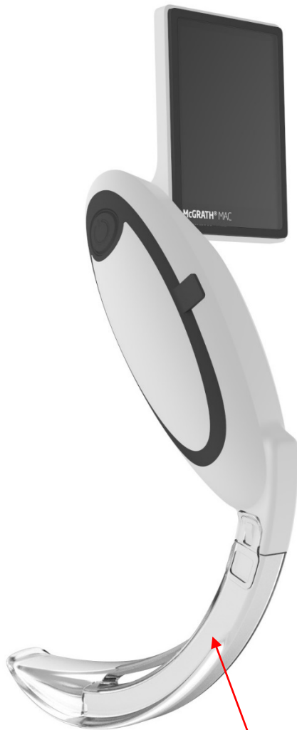
CameraStick™ (Tudo na mesma cor)