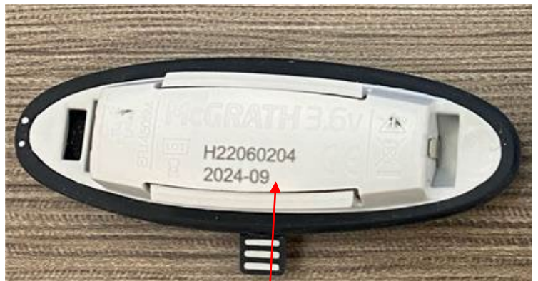
Bateria McGRATH™ 3.6V Verso - Data de Validade